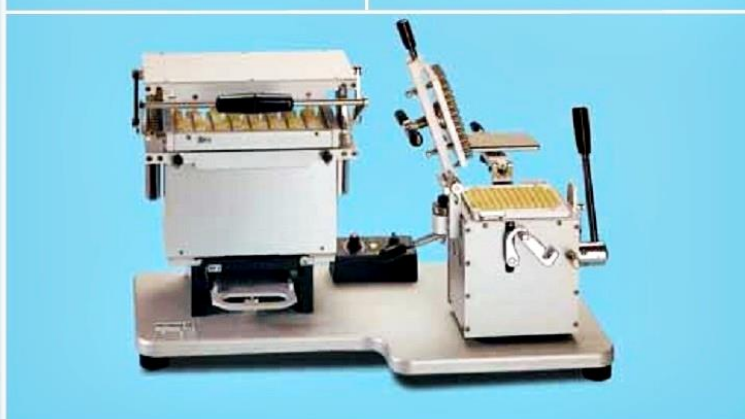
MINICAP 100 Orientating + filling unit The smallest solution: two units in one only basament. Hourly output: up to 2500 capsules