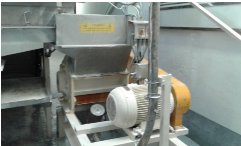
Foto en la instalación original donde funcionaba

La extracción del producto en la instalación de donde fue retirado, se hacía por transporte neumático mediante una bomba soplante de 5,5 KW (bomba no incluida)