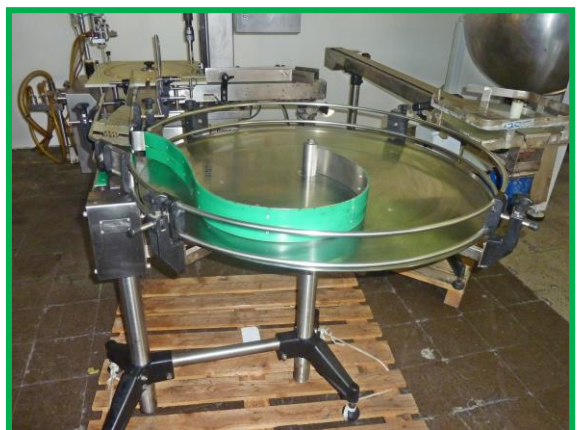
Fotos de la máquina según estado a su recepción