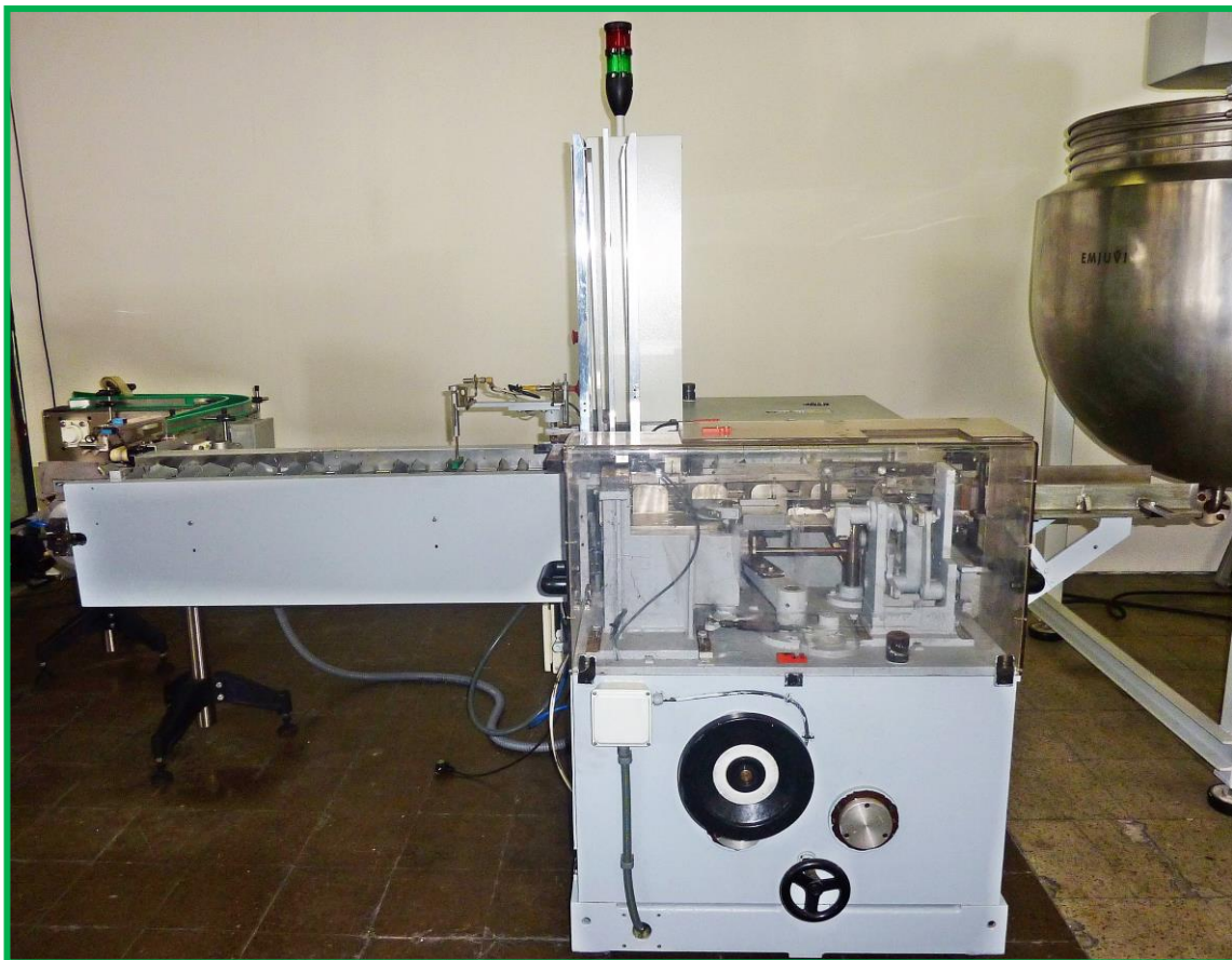
Foto antes de reacondicionar máquina

Estuchadora de movimientos alternos, para la introducción en cajas de diferentes tipos de productos sin prospecto.